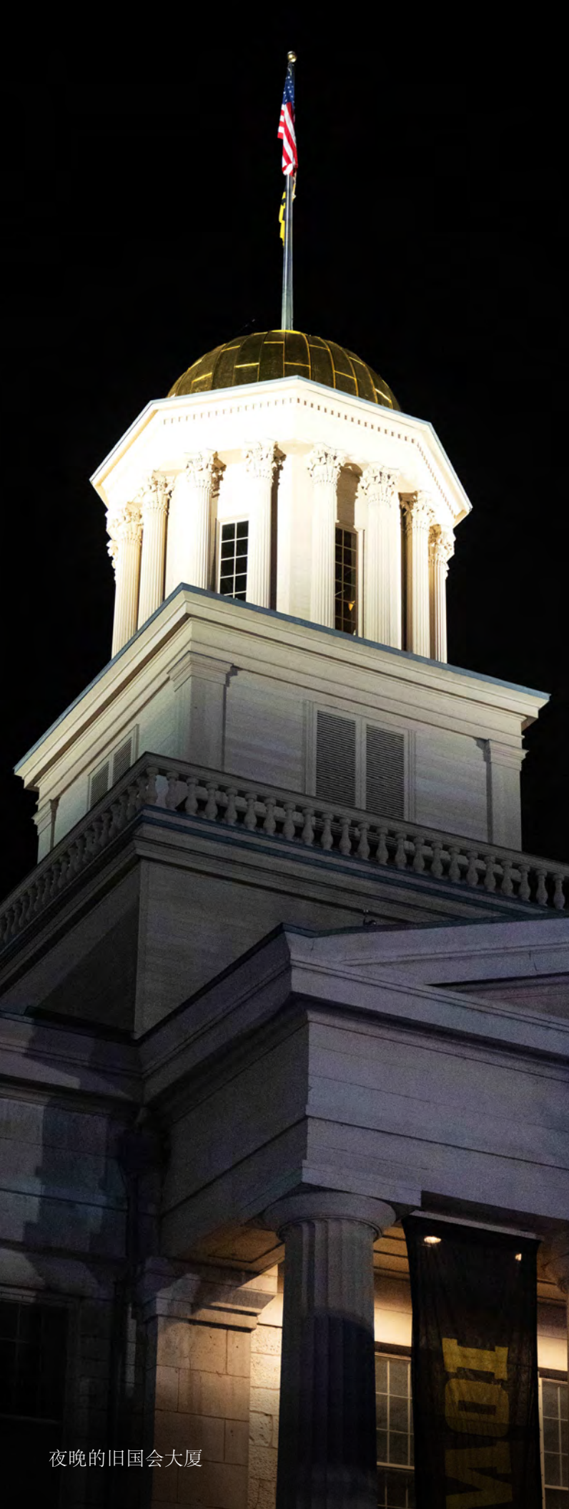
夜晚的旧国会大厦